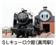
SLキューロク館(真岡駅)